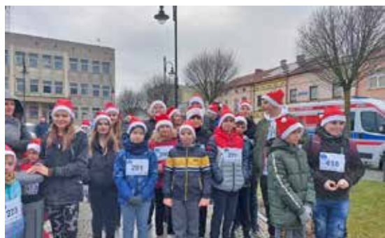
Uczniowie SP Łubno