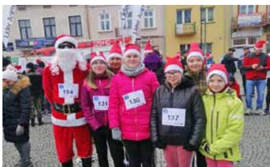
Uczniowie SP Ulanica