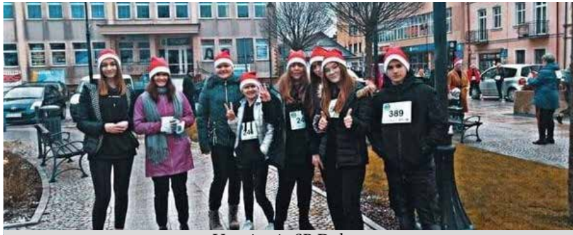
Uczniowie SP Dylagowa