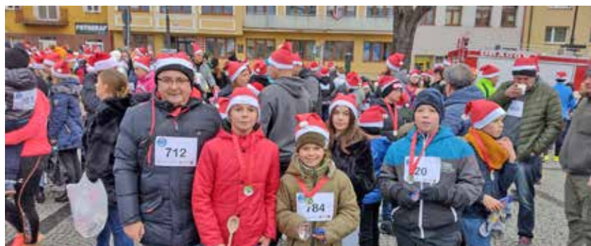
Uczniowie SP Harta Nr1

Podczas biegu mogliśmy również zobaczyć uczniów naszych szkół zarówno starszych jak i młodszych wraz z rodzicami.